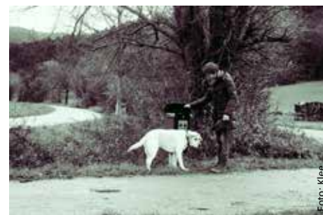
„Wir machen mit ...“