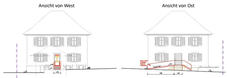
Bürgercafé - Altes Rathaus